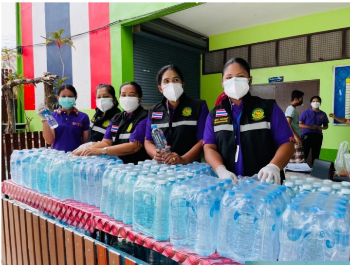
ภาพประกอบการดำเนินการเสริมสร้างค่านิยมและวัฒนธรรมองค์กร