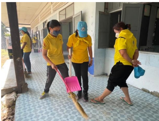
ภาพประกอบการดำเนินการเสริมสร้างค่านิยมและวัฒนธรรมองค์กร